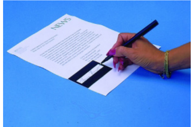
Figure 3: Signature guide